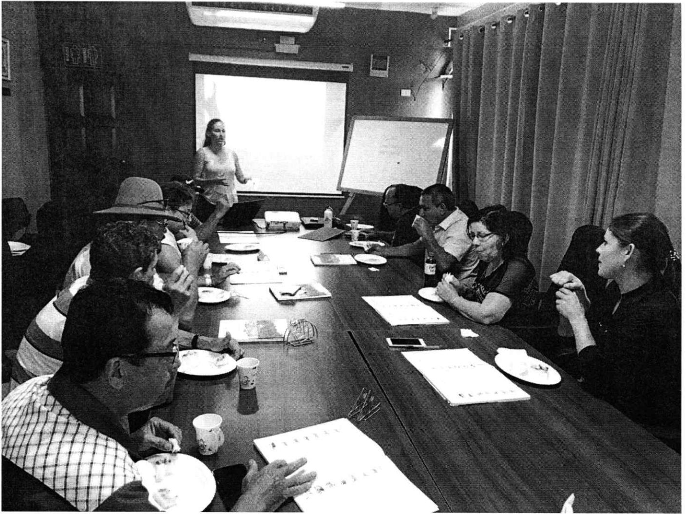
Figura 5. Capacitación a productores por parte del PNUD en temas de igualdad de género y cuaderno de finca.