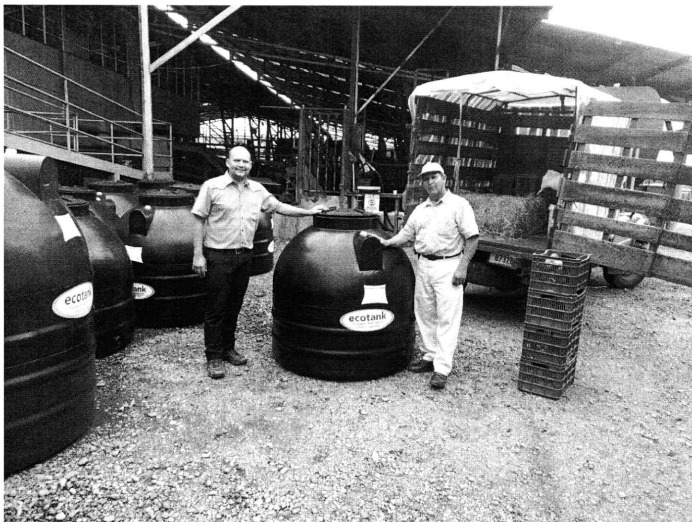
Figura 3. Entrega de tanques de agua a los productores, para alimentar los bebederos para el ganado.