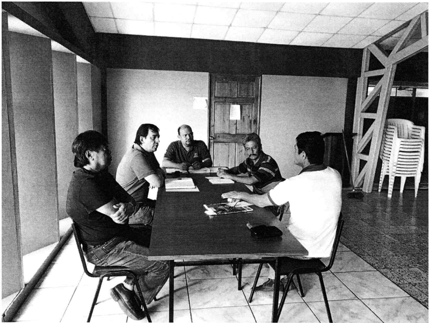
Figura 4. Reunión con el Ingeniero forestal de la Cámara de Ganaderos, con participación del MAG y PNUD dando seguimiento al proyecto.