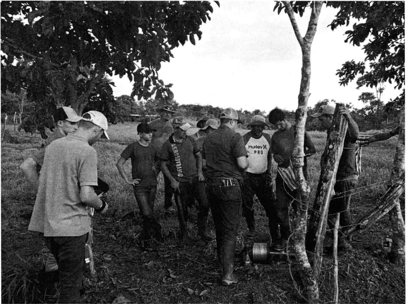
Figura 2. Talleres prácticos grupales en la implementación de cercas eléctricas.